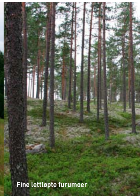
Fine lettløpte furumoer