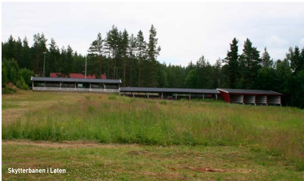
Skytterbanen i Løten